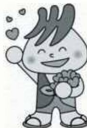
川口市社会福祉協議会 マスコットキャラクター「社助」

青少年ボランティアスクールは、さまざまなプログラムから、参加したい体験を選んで、ボランティアの体験をすることができます。自分にできることや、関心のあることを見つけて、申し込んでください。